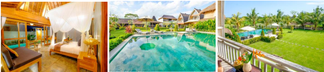
Gambar 4. Desain Villa Canggu Wooden Green Paradise

Prinsip working with climate atau bekerjasama dengan iklim setempat dapat dilihat pada bentuk atap yang lancip dengan kemiringan tertentu yang bertujuan agar air hujan dapat dengan mudah turun ke tanah. Selain bentuk atap, prinsip working with climate juga dapat dilihat dari bukaan-bukaan yang lebar dengan material kaca serta rangka atap expose yang bertujuan memberi kenyamanan termal di dalam ruangan dikarenakan sirkulasi udara yang lancar.