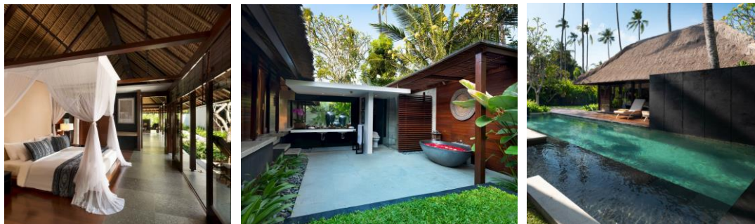
Gambar 2. Penggunaan material pada desain Villa Kayumanis Jimbaran