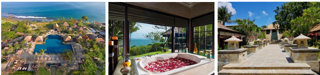
Gambar 3. Ayana Resort and Villa

Interior Ayana Resort and Spa Bali diaplikasikan dengan membuat elevasi pada bagian elemen plafond. Desain plafond memperlihatkan struktur rangka dan material sehingga jarak antara plafond dan lantai menjadi tinggi. Jarak ini dapat dijadikan salah satu cara untuk menyiasati pengaturan kondisi termal dalam ruang mengingat hotel ini berada di pinggiran pantai yang memiliki cuaca panas. Udara panas hasil penyerapan material atap akan mengalami penurunan intensitas selama berada di plafond sehingga kondisi pada area aktivitas dapat kembali normal. Penerapan cross ventilation juga digunakan oleh kamar-kamar dan ruangan yang ada di Ayana Resort and Spa.