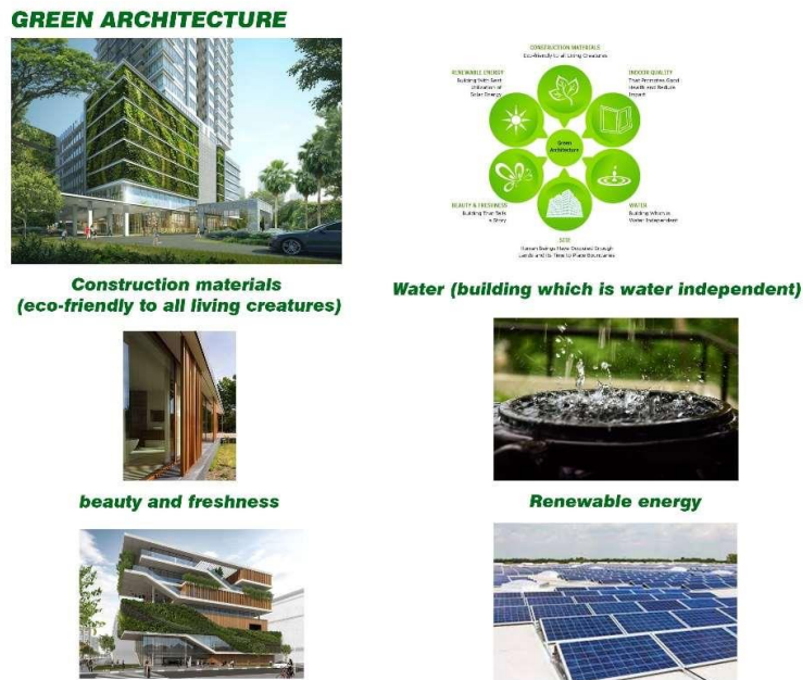
Gambar1. Penerapan Prinsip Green Architecture

Sumber daya terbarukan dikenal sebagai sumber daya aliran yaitu sumber daya alam yang akan mengisi kembali untuk menggantikan bagian yang habis karena penggunaan dan konsumsi. Salah satu renewable energy yang diterapkan pada bangunan yaitu penggunaan sun energy atau panel surya sehingga mampu meminimalisir penggunaan energi buatan dan menjadikan bangunan lebih hemat energi.