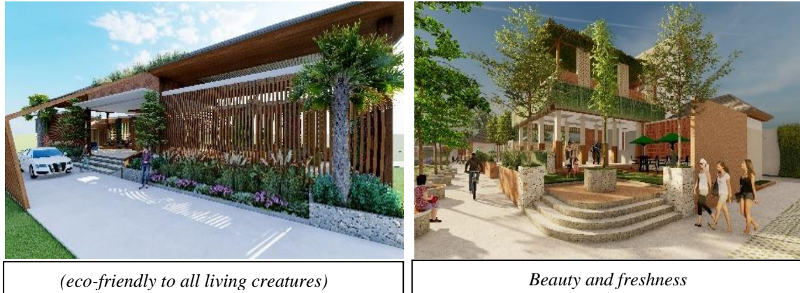
Gambar 1. Penerapan Prinsip Green Architecture pada Bangunan

Sebagai tempat pusat pelatihan pertanian dengan tema green architecture konsep fasad bangunan dengan menerapkan prinsip contruction material (eco-friendly to all living creatures) atau penggunaan material ramah lingkungan diterapkan pada penggunaan material kayu pada fasad baik indoor maupun outdoor, water (building which is water independent) atau pengolahan dan pemanfaatan kembali limbah air kolam ikan lele kemudian di fermentasi kemudian bisa dimanfaatkan kembali sebagai pupuk tanaman, penerapan prinsip beauty and freshness pada bangunan fasad menggunakan material alam yaitu perpaduan material lokal yaitu batu bata (roster) dengan kayu WPC, serta pengaplikasian tanaman rambat dan vertical garden sebagai hiasan pada fasad dan penerapan renewable energy yang diterapkan pada bangunan yaitu penggunaan sun energy atau panel surya sehingga mampu meminimalisir penggunaan energi buatan dan menjadikan bangunan lebih hemat energi.